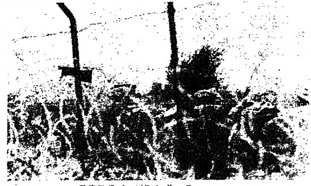
مواقع اسرائيلية وراء الاسلاك الشائكة

شب حريق في محل « بوسي كات » للائحة بجناب فندق « كومودور » امس . واضطر رجال الاطفاء لكسر باب المحل الذي كان مغلقا ، لايجاد النيران .